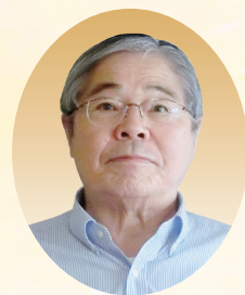
北広島町社会福祉協議会 会長