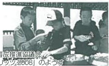
北広島町青少年育成推進協議会「トムソーヤスピリッツ2008」の様子

社協事業分は、広報活動事業・劇団観賞・発達障害児支援事業「この指とまれ」・障害者外出支援「七夕会」・福祉車両維持等に活用いたしました。