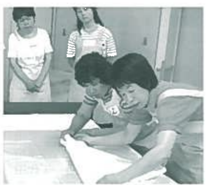
(ヘルパー養成研修) 介護の仕方、ポイントを知っていると役に立ちます。