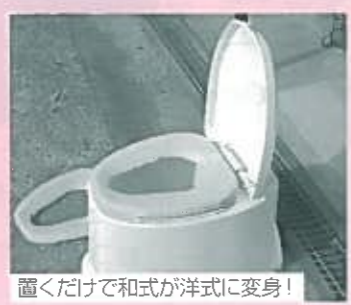
置くだけで和式が洋式に変身!