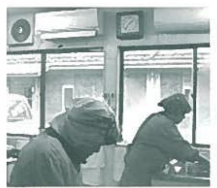
(食の確保事業) 温度・湿度管理によって安全な配食にこころがけます。