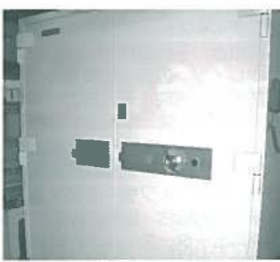
(財産保管サービス事業) 財産管理が不安な方の通帳・証書等お預かりします。