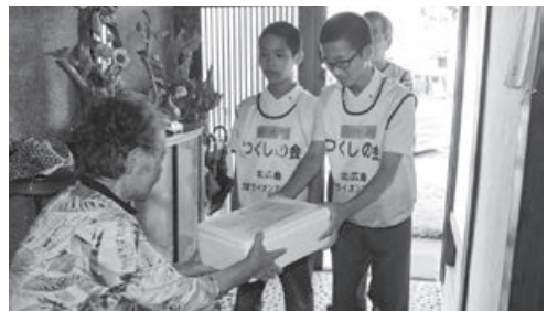
(中学生による配食ボランティア体験)