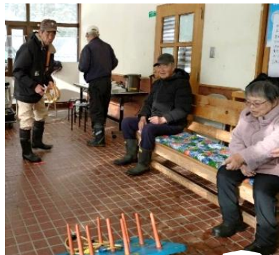
外は雪でも、輪投げで運動不足解消！