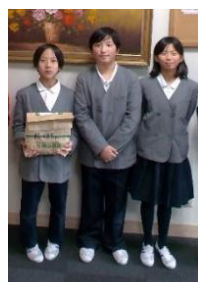
豊平学園の皆さん

芸北小・中学校、本地小学校、千代田中学校、豊平 学園の皆さんから、学校募金をいただきました。 豊平学園では今年は児童生徒会の皆さんが、3日間 玄関に立って呼びかけをされたそうです。 集まった募金は、北広島町内の地域福祉活動に活用 させていただきます。ありがとうございました。