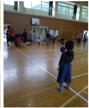
↑本地地域「スポーツを楽しむ会」のようすです