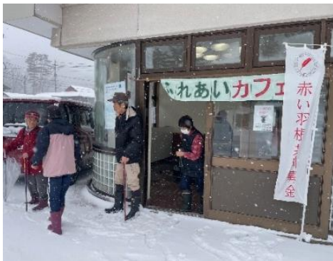
素敵なのれんが飾ってあります。バスを待つ方も気軽に立ち寄れます。

芸北地域の川小田中央バス停内で、毎月第4木曜日に「認知症予防ふれあいカフェ川小田」が開催されています。今回共同募金を活用し、皆さんが快適に過ごせるよう、ストーブと扇風機を整備されました。