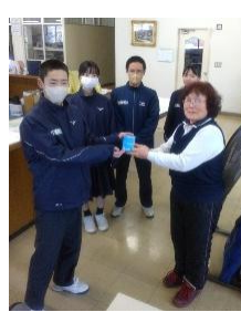
芸北中学校の皆さん