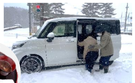
自分で来るのがむずかしい方は、乗り合わせて参加されています。

このカフェは、認知症を正しく理解しておくことで、認知症になっても孤立することなく、みんなが住み慣れた地域で暮らしていけるようにとの思いで、芸北地域の生活支援コーディネーターさんが地域の皆さんと一緒に開催されています。