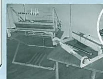
作品の一例と、織り機

織り機の特徴 自分の持つて生まれた感性を最大限に引き出し、常識や既成概念にとらわれず、自由奔放に、好きに好きに織る。そうすることで自分の秘められた感性が最大限に引き出されると考えています。出来上がった布は、自分でも驚くほど、自己の感性がそのまま表現されます。どなたでも簡単に織りを楽しむことができます。