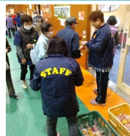
愛情込めて作られた芸北りんごをお土産に渡されました。

参加者の皆さんは、「楽しかった。」「新しい友達ができた。また会う約束をした。」「初めてのルールだったけど説明がわかりやすかった。」「木のメダルが素敵!」と話されていました。