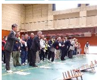
来賓の皆様による始投式。 見事全員入りました。