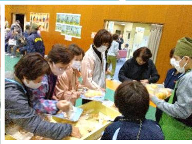
障害者支援センターさあくるの皆様もパンの販売で応援に来てくれました。