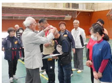
芸北の木を使った特製メダルの授与。デザインは北広島町老連会員章をモチーフにされました。