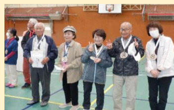
第3位：阿坂老人クラブ

「ミニ社協だより」は、音声による広報としてカセットテープやCDに録音して貸出しています～ この広報紙は、みなさまからの会費、共同募金をもとに作成しています