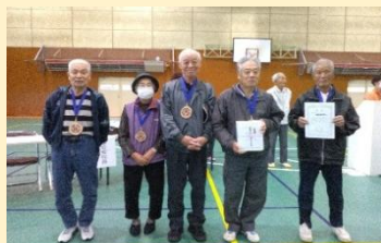
第2位：南郷温友会Bチーム