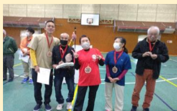
第1位：細見報徳会Aチーム