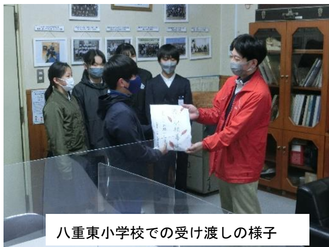
八重東小学校での受け渡しの様子

皆様からの募金は、より暮らしやすい北広島町のために活用させていただきます。ありがとうございました。