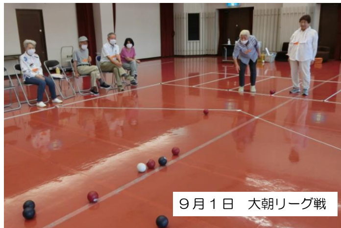
9月1日 大朝リーグ戦

「ボッチャ楽しい！」 「もっと練習がいるね」 「テクニックや戦術を指導してほしい」