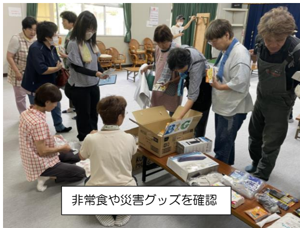
非常食や災害グッズを確認

10月には、八木の「広島市豪雨災害伝承館」への視察研修も予定されています。今後は、こうして地域のみんで集まって、日頃からの声かけや、いざという時にご近所同士で支え合うためにどうしていくか、話し合っていけます。