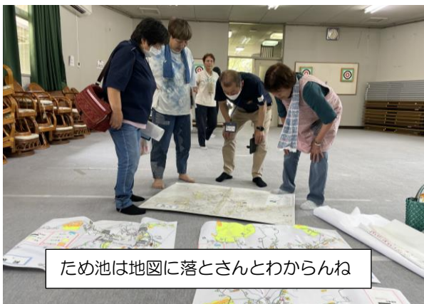
ため池は地図に落とさんとわからんね

7月23日（日）、避難所にもなっている「阿坂老人憩の家」で、北広島町危機管理課から講師を招き、自治会役員と合同で、防災についての勉強会が行われました。