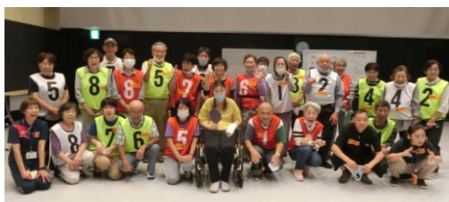
千代田ボッチャ教室