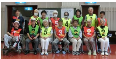
8月18日 大朝ボッチャ教室