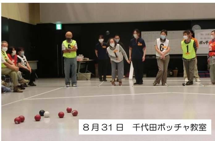
8月31日 千代田ボッチャ教室

子どもから大人まで誰でも一緒にできるスポーツ「ボッチャ」を通じて、新しい出会いや交流が生まれています。8月、9月の様子をお伝えします。