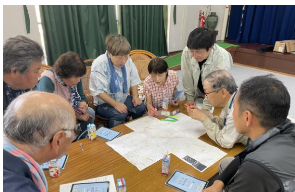
自分の家が危険区域に入っているとは知らなかった

北広島町女性会阿坂支部の皆さんは、赤い羽根共同募金を活用し、安心安全の地域づくり活動として「支えあいマップづくり」に取り組まれています。