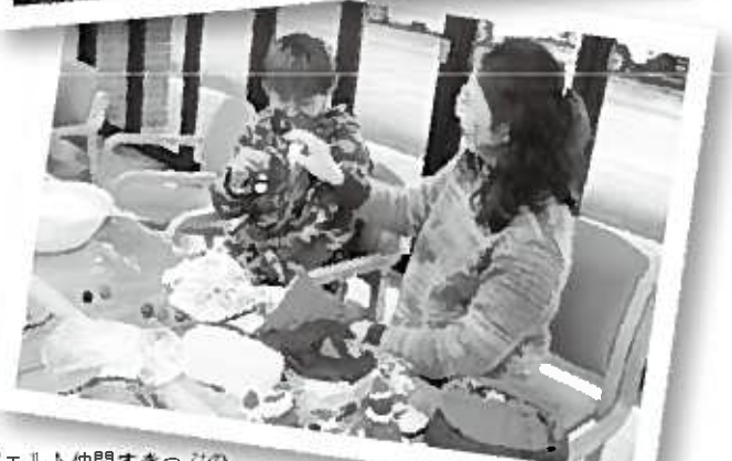
フェルト仲間すきっぷの活動風景