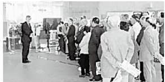
役場本庁視察の様子

地域のことを知りたい、学びたいなど「～したい」を老人クラブで実現することができます。老人クラブは地域に密着した当事者団体です。地域のこと、自分のこと、皆さんと一緒に老人クラブで考えませんか。