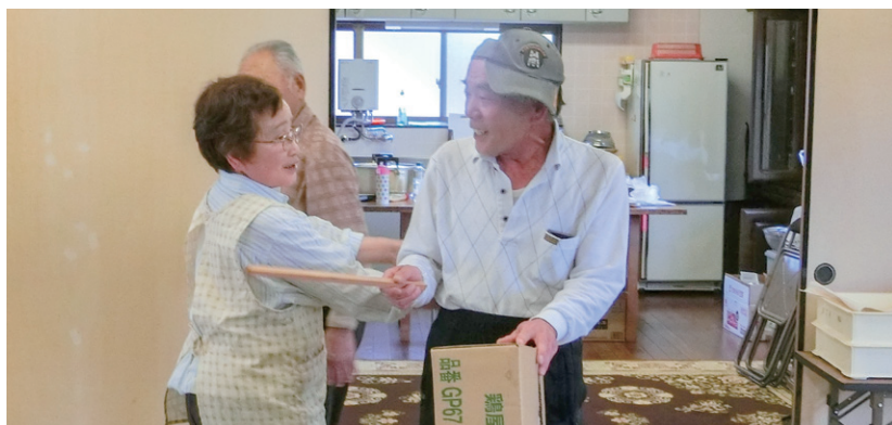
ダンボールを太鼓にお囃子を思い出して…